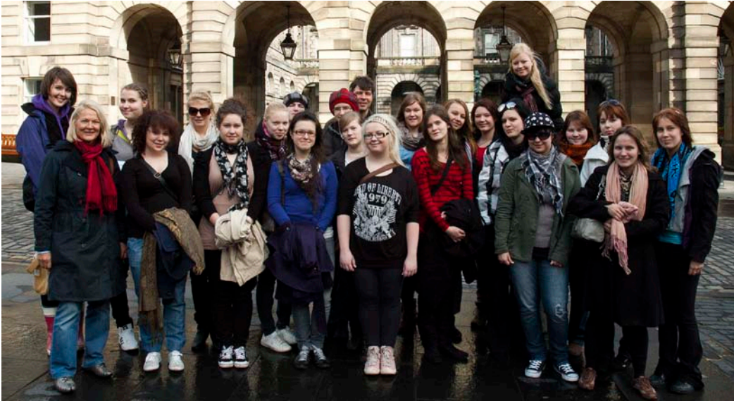
Leirikoululaiset opettajineen ja huoltajineen Edinburghissa.