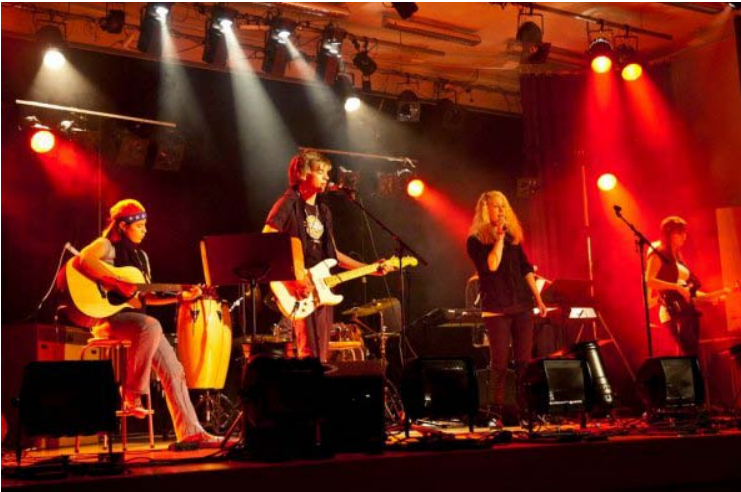
Bändikonsertin tunnelmia 1.11.2010

Musiikin opiskelu ja opetus näkyy paitsi Salon lukion arjessa myös erityisesti juhlatilanteissa. Lukuvuoden jo perinteisiä juhlia ovat muun muassa itsenäisyyspäivän juhla, yo-juhlat sekä Kauneimmat joululaulut Uskelan kirkossa. Näkyvyyttä ja suosiota ovat saavuttaneet musiikin lukiodiplomikonsertit, projektikurssin (MU 5) konsetti sekä bändikurssien konsetti. Kuoro ja orkesteri ovat järjestäneet myös välituntikonsertteja.